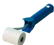
ROLLER pág. 326