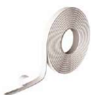
SUPRA BAND pág. 132