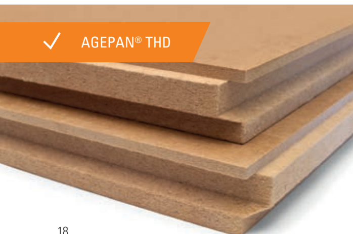
✓ AGEPAN® THD