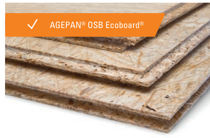
✓ AGEPAN® OSB Ecoboard®

Os componentes perfeitamente compatíveis entre si, tais como os painéis AGEPAN® OSB e os painéis isolantes de fibra de madeira AGEPAN®, permitem criar telhados permeáveis ao vapor e elementos de construção de paredes sem ser necessário utilizar uma película de barreira de vapor.