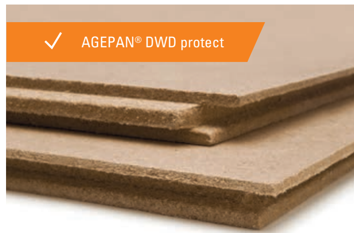
✓ AGEPAN® DWD protect